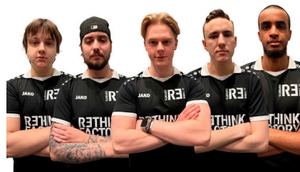
”En investering i framtidens kompetens.” CS2-laget ReThink Esports har både SM-guld och Elitserie-silver i bagaget.

Företaget har sin bas på Bredasten i Värnamo och arbetar nära industrin i Gnosjöregionen, med fokus på serieproduktion i additiv tillverkning där funktion, kravbild och affärslogik styr materialval och konstruktion.