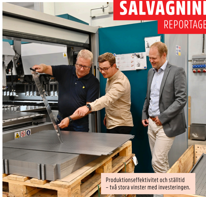
Produktionseffektivitet och ställtid - två stora vinster med investeringen.