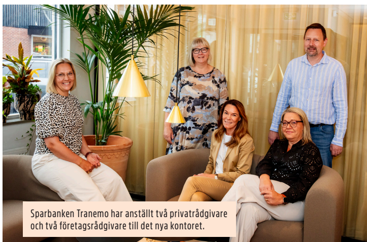
Sparbanken Tranemo har anställt två privatrådgivare och två företagsrådgivare till det nya kontoret.